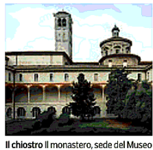
Il chiostro Il monastero, sede del Museo