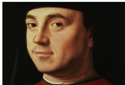
ANTONIO DI GIOVANNI DE ANTONIO (ANTONELLO DA MESSINA)